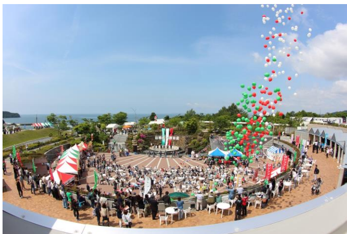
写真：サンファンまつり 「サン・ファン・パウティスタ」復元船の 進水日をお祝いする記念イベント